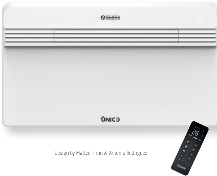
Design by Matteo Thun & Antonio Rodriguez